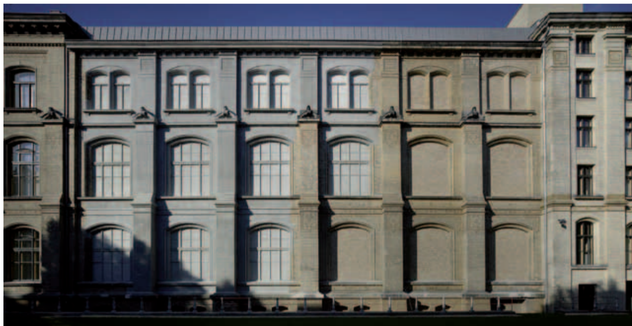
Der wieder aufgebaute Ostflügel des Naturkundemuseums überzeugte die Jury.

Architekten-Bund würdigt Bauprojekt im Museum für Naturkunde