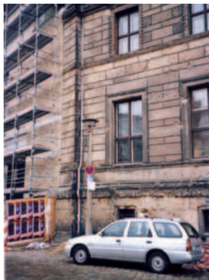
Die Universität braucht auch zusätzliches Geld, um Hochschulbauten zu sanieren – wie in die Dorotheenstraße 1.

„Wenn der erreichte Standard gehalten und fortentwickelt werden soll, muss der Senat diese Erwartung mit einer höheren Grundfinanzierung absichern, denn sonst müssten Studienplätze abgebaut werden“, sagte HU-Präsident Prof. Jan-Hendrik Olbertz. Für die ansteigenden Tarife und die wachsenden Pensionslasten erwarten die Universitäten im Jahr 2017 eine Steigerung von 77,6 Millionen Euro. Unklar ist, wie die zusätzlichen Personalkosten gedeckt werden, die sich aus dem Gerichtsurteil zur W-2-Besoldung ergeben. Die Universitäten haben errechnet, dass die Inflation und die steigenden Ener-