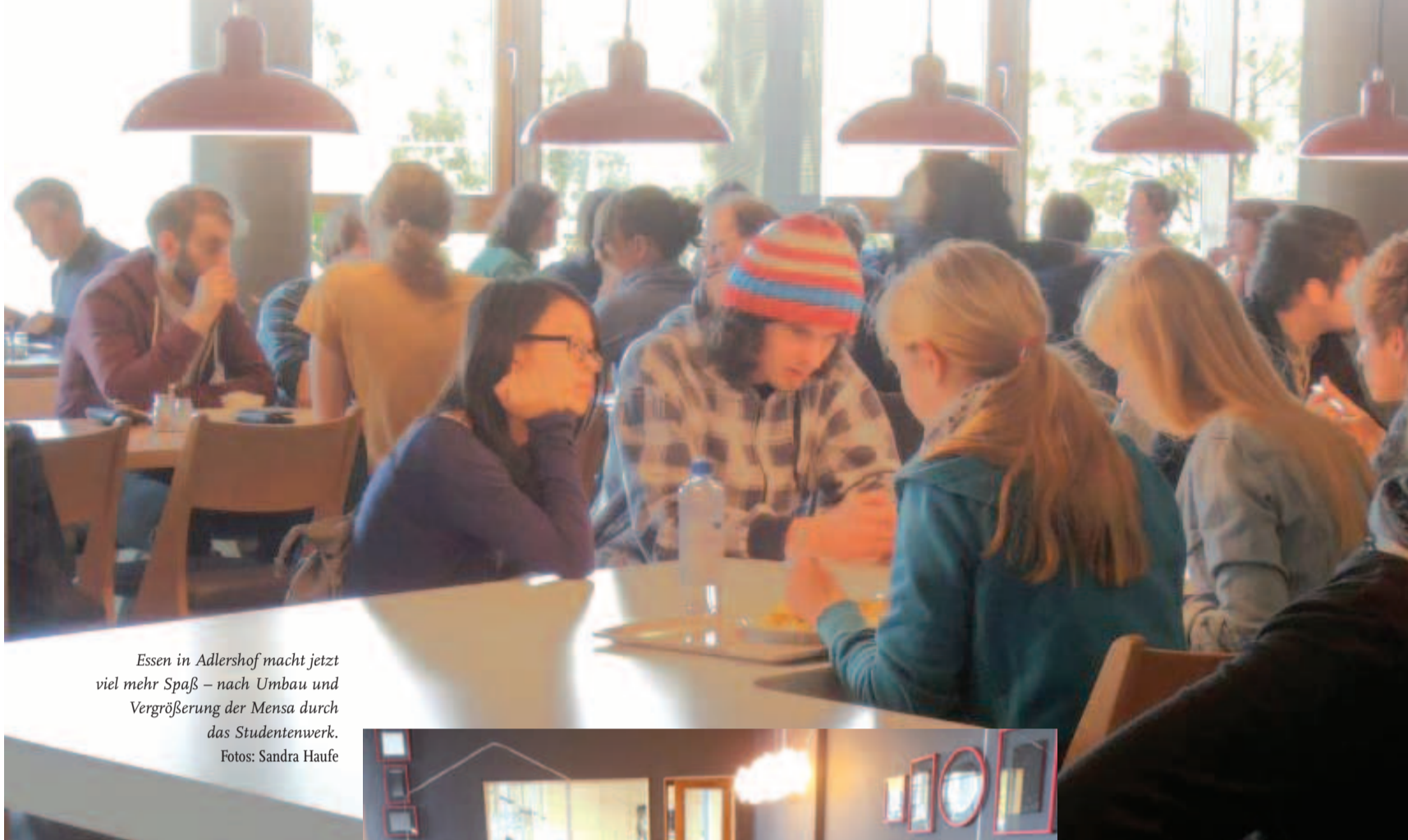
Essen in Adlershof macht jetzt viel mehr Spaß – nach Umbau und Vergrößerung der Mensa durch das Studentenwerk.

Die Mensa auf dem Campus Adlershof nimmt den Vollbetrieb wieder auf