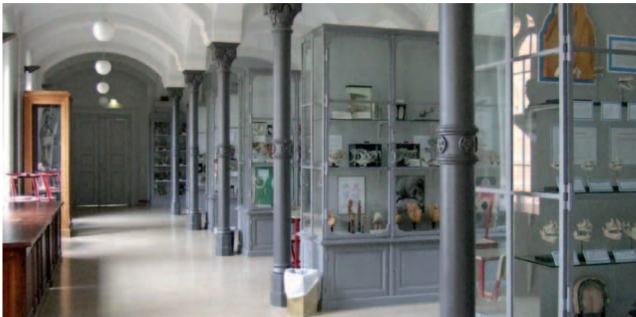
Ein Raum zum Schauen und Studieren.