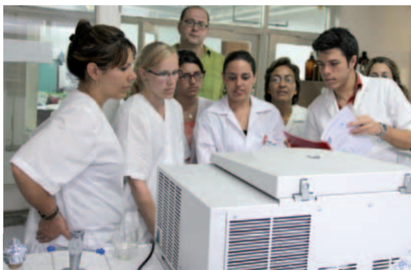
Die kubanischen Teilnehmer führten Experimente durch, die sie zum ersten Mal in ihrer Ausbildung kennengelernt haben.