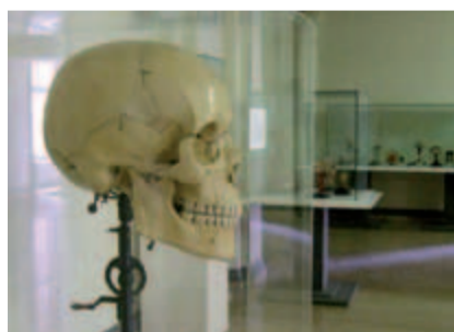
Riesiger Holzschädel und ein Handpräparat mit sichtbar gemachten Blutbahnen (rechts).

Der für die Anatomie entscheidende Schritt bestand jedoch vor allem darin, dass sich nun der Charakter der Sammlung von einem Teil der höfischen Raritäten- und Kunstkammer hin zum Fundament für